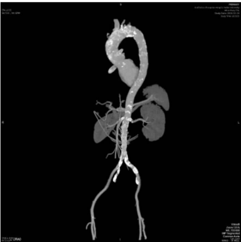
图 1 大动脉炎的主动脉计算机体层血管造影

大动脉炎主要影响主动脉及其一级分支,左锁骨下动脉的近侧段或中段、左颈总动脉、左椎动脉、头臂动脉、右锁骨下动脉中段或近端、右侧颈动脉、右椎动脉和主动脉也可能受累(见图 1、2)。手术中肉眼观,被累主动脉管壁明显增厚、变硬。内膜表面凹凸不平,重者有多个斑块隆起,其间为纵行或星状皱纹(树皮样皱纹),受累管腔明显狭窄,甚至被纤维组织完全阻塞。