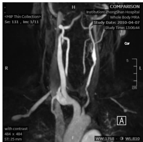
图 2 主动脉弓和劲动脉核磁共振成像